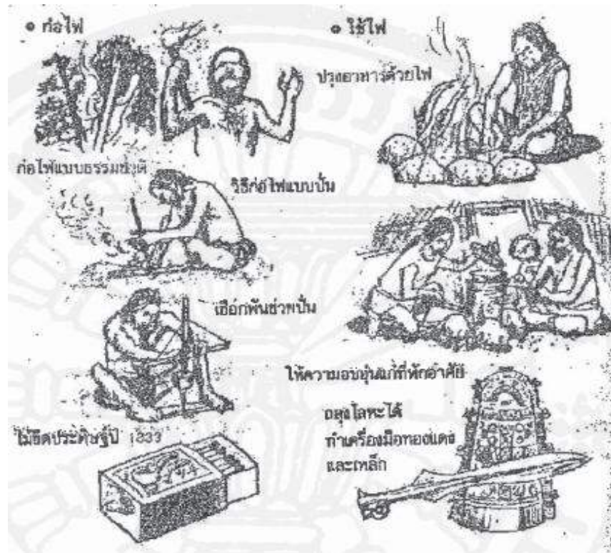
ภาพที่ 2.2 การปรับปรุงเครื่องมือการดำเนินชีวิตในอดีต. จาก เพลดเพลินเป็น 100 เท่า กับการเสนอแนะเพื่อการปรับปรุง: วิธีดำเนินกิจกรรมการปรับปรุงและวิธีเพิ่มพลังความคิด สร้างสรรค์ (น. 60), โดย วีรพจน์ ลือประสิทธิ์สกุล, 2544, กรุงเทพฯ: ธรรมมลการพิมพ์.